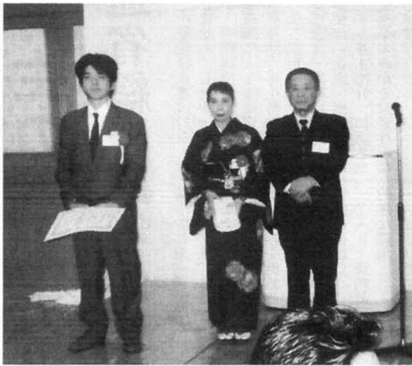
優良従業員表彰された皆さん

取り巻く環境は依然厳しい 独自の工夫を凝らして適正 が、中部地区では愛知万 価格に近づけていくことを 博、空港関連の仕事などで 期待するとともに、今年度 回復傾向と同時に受注単価 こそ全員が一致団結して業 も徐々に戻りつつあると聞 務の推進を図っていくこと きます。当組合においても を心から念じております」