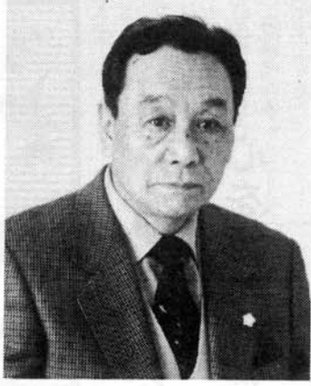
陛下皇居に参内し、天皇 陛下にお言葉 を賜わるとともに、 皇居に参内し、 夫人と共に拝謁の栄 耀を賜わりました。

平成十四年秋の叙勲に際 し、はからずも「勲六等瑞 宝章」受章の栄に浴しまし た。 去る平成十四年十一月十 五日、東京・赤坂プリンス ホテルにて勲記、勲章の伝 達を受け、引き続き家内共 々皇居に参内し、豊明殿に おいて天皇陛下に拝謁の栄 耀を賜わりました。 (平成十四年 十一月二十五日)