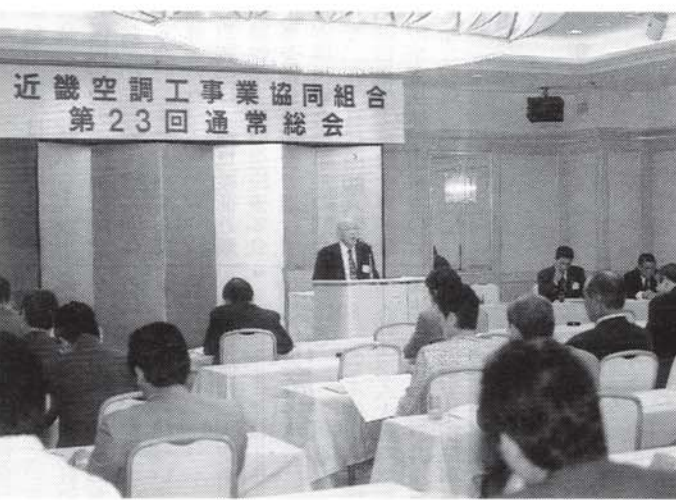
第23回通常総会会場