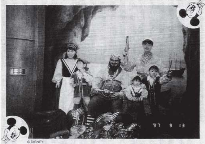
3人の子供と夫⑥、私⑤（東京ディズニーランドで）

孝者だ。そんな私も、はや三児の母。サザエさんちのように、私の両親と優しい夫、やんちゃな子供たちと仲良く暮らしている。六歳、四歳、三歳と、ほとんど年子の三人をかかえる私は、毎日が子育てに追われている。三人とも性格がばらばらで、年が近いせいか兄妹というよりライバルなのである。神経質そうに見えるが、実は繊細な次男、わがまま放題の長女、個性豊かな子供たちにすっかり振り回される毎日だ。長男を出産するまで幼稚園で教職に就いていた私