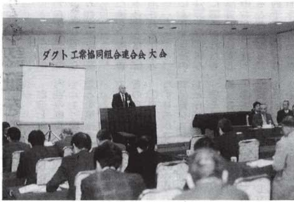
当協同組合の総会