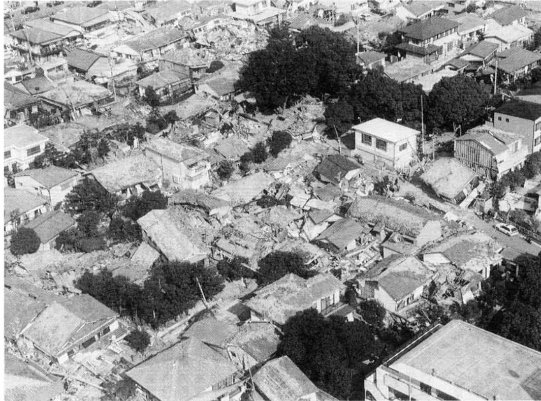
▶住宅が大破壊した神戸市内