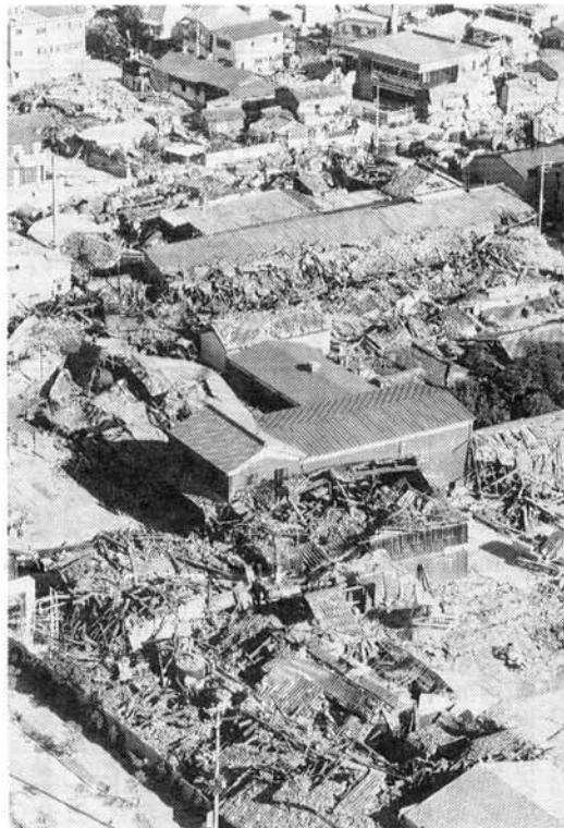
▶倒壊した西宮市内の酒蔵