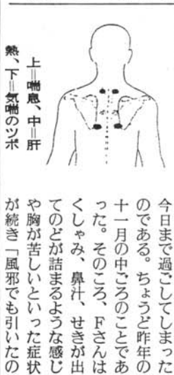
上=喘息、中=肝熱、下=気喘のツボ

六、わが子に、孫に、世間さま。どなたからでも慕われる、ええ年寄りになりなはれ。ボケたらあかん、そのために、頭の洗濯、生きがいに、何か一つ趣味持って、せいぜい長生きしなはれや。