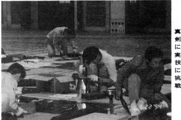
真剣に実技に挑戦