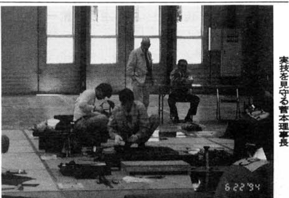
実技を見守る管理部長