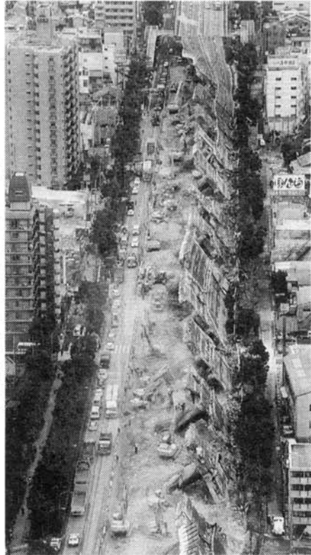
▶横転しになった阪神高速神戸線(神戸市東灘区)