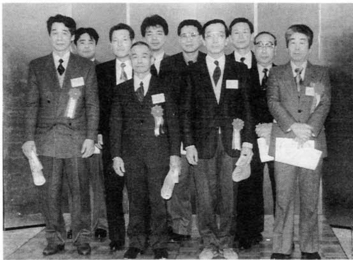
表彰された皆さん