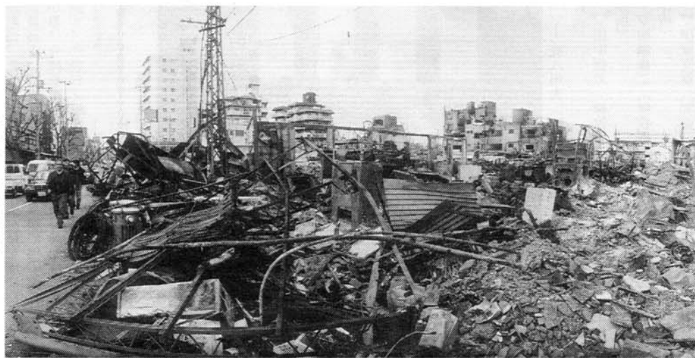
▶神戸市 の家庭焼失跡