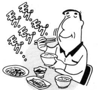
ゆっくりと噛めば噛むほどガンは遠のく