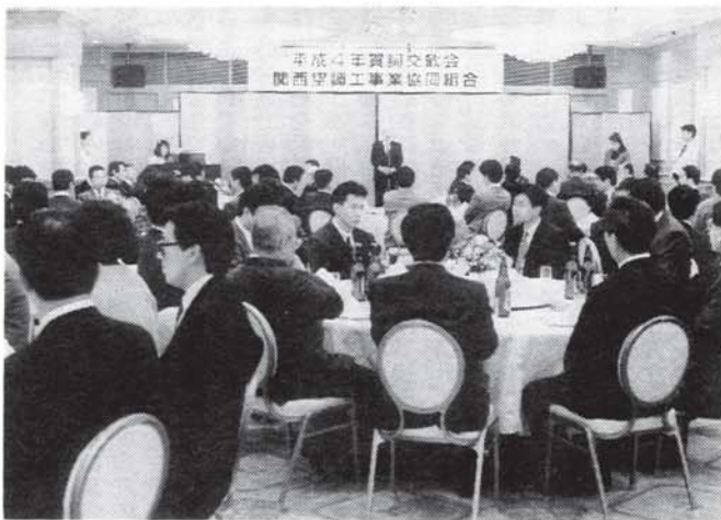
なごやかな懇親パーティー