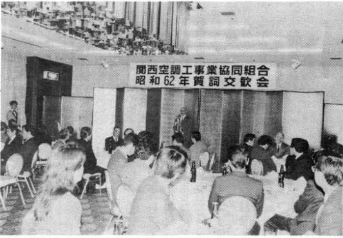
パーティーで和やかに歓談