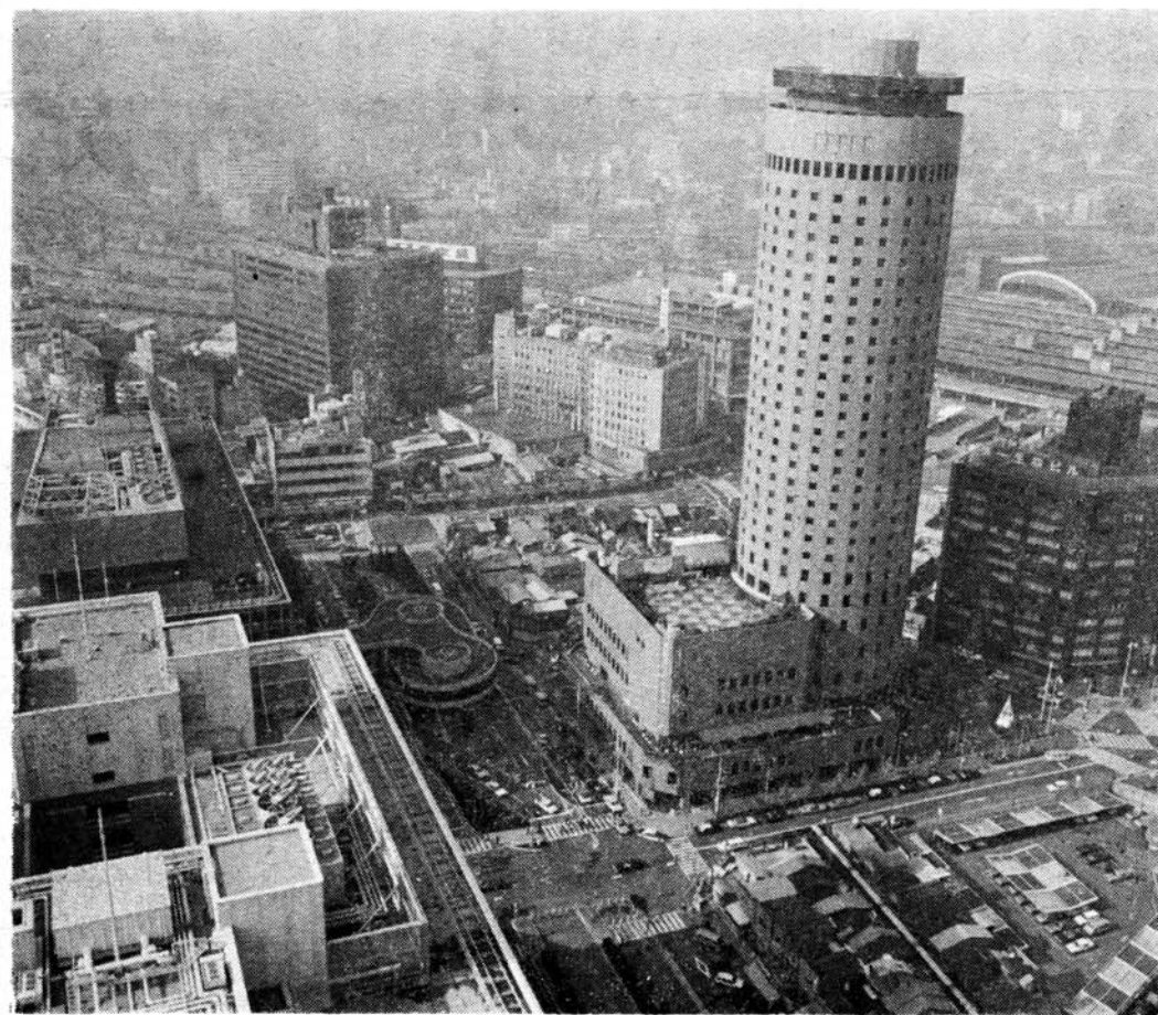
'80年代の大阪を象徴する駅前ビル街

四月は当組合の年度替わりであります。政府は既定方針に沿って景気は二の次、物価優先の施策を強力に打ち出してはおりますが、何分にも海外要因に基づく価格上昇ですから、決して安易なものではありません。加率的にこれが私達を襲うことは明らかで、片や公共工事量の減少というダブルパンチを受けて、中小建築業者の先行きは、昨年倍増しての多難苦闘一途には優勝劣敗の正念場の年となることは避けられそうにありません。 どうぞお互い細心の警戒を払いながらも、突発する変化に勇気を以て対応する柔軟な機動性を堅持して参りたいものです。 さて当組合は、今年創立五周年の記念すべき年を迎えました。即ち五年前の四月十六日に創立総会を持ち事実上の歩み始めたのであります。 この年は、あたかも第一次の石油ショックによる混乱の最中であつた為もあり願ひてその後の歩みにおいては残念ながら不祥事も続いたわけですが、幸いに私達は、ピンチを却ってチャンスに替え、不死鳥の如く苦難を克服して五周年を記