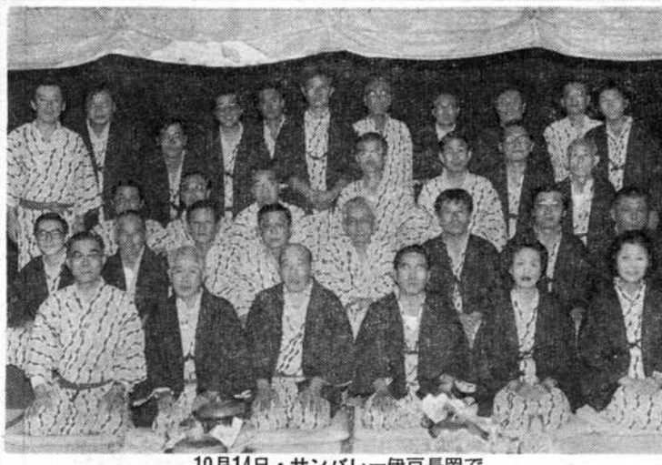
10月14日・サンパレー伊豆長岡で

目的のホテルに着くが早い、恒例の協議会を開催。(上)いで湯で旅の疲れをさっぱり、こんどはちくつるいで懇親の宴、余興も相次ぎ、けっこうでした。