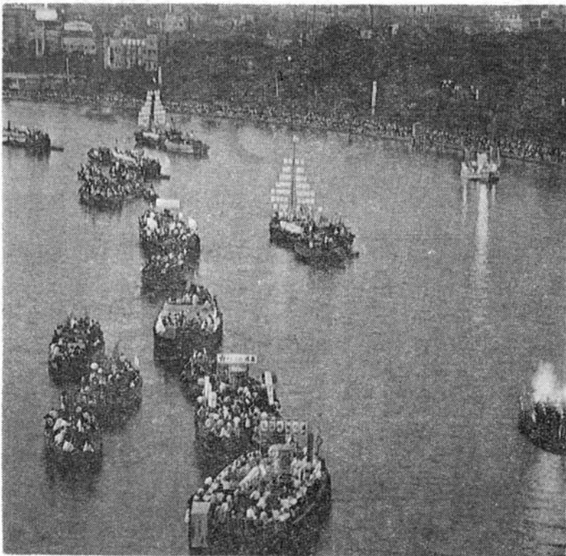
大阪夏の夜の風物詩「天神祭」船渡御