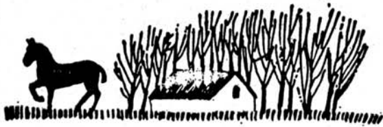
うまに因むことわざいろいろ