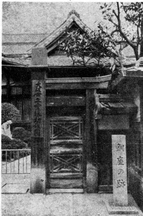
愛珠幼稚園の門前にある「銅座跡」の碑