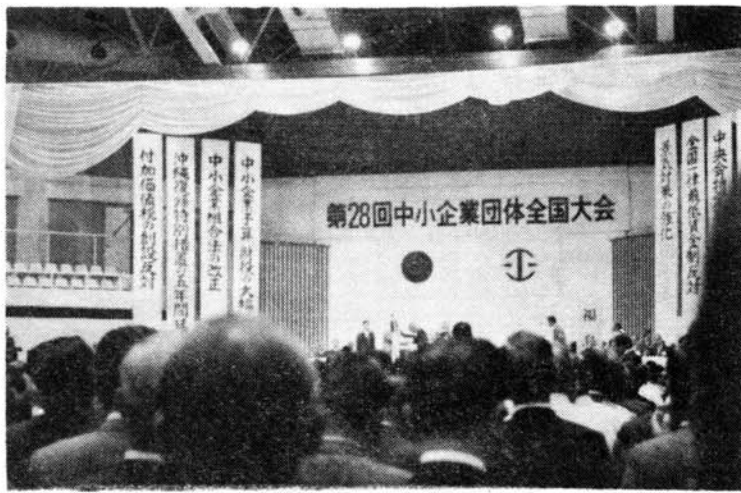
写真(中)は、盛大に催された全国大会の会場。 左はひめゆりの塔を前に筆者たち。

各府県の中小企業団体の代表が毎年中央会単位で参加して催される全国大会は、数えて本年は二十八回、さしまたので以下要点的のみを十月二十八日に総勢四千五百名が参集、沖繩県の主催により沖繩市(旧コザ市)で開かれました。